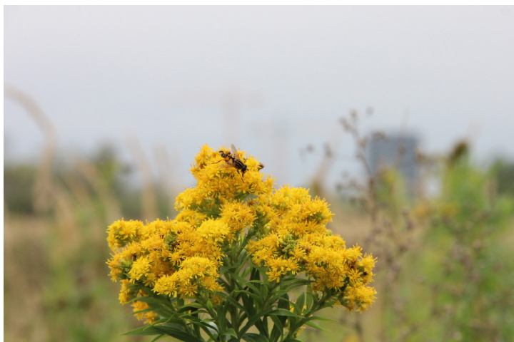
Områdets natur er ikke så gammelt, som det øvrige Fælleden, og har ikke samme sjældne planter