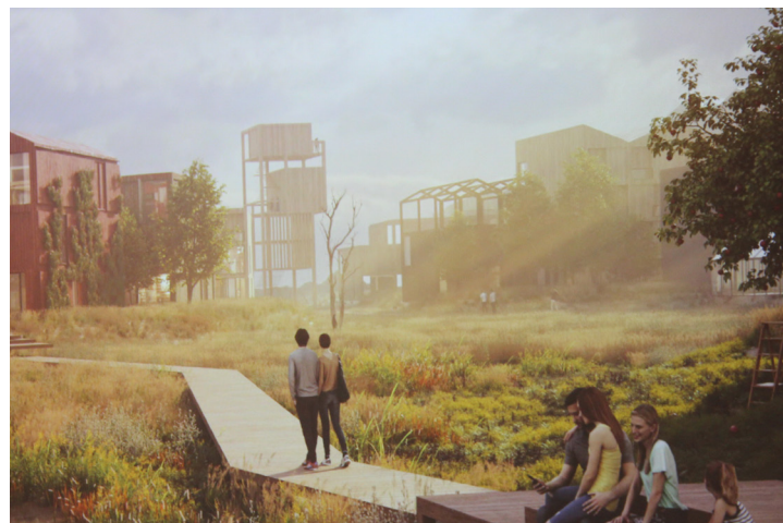
Der er derfor god grobund for at etablere en større artsrigdom af planter.