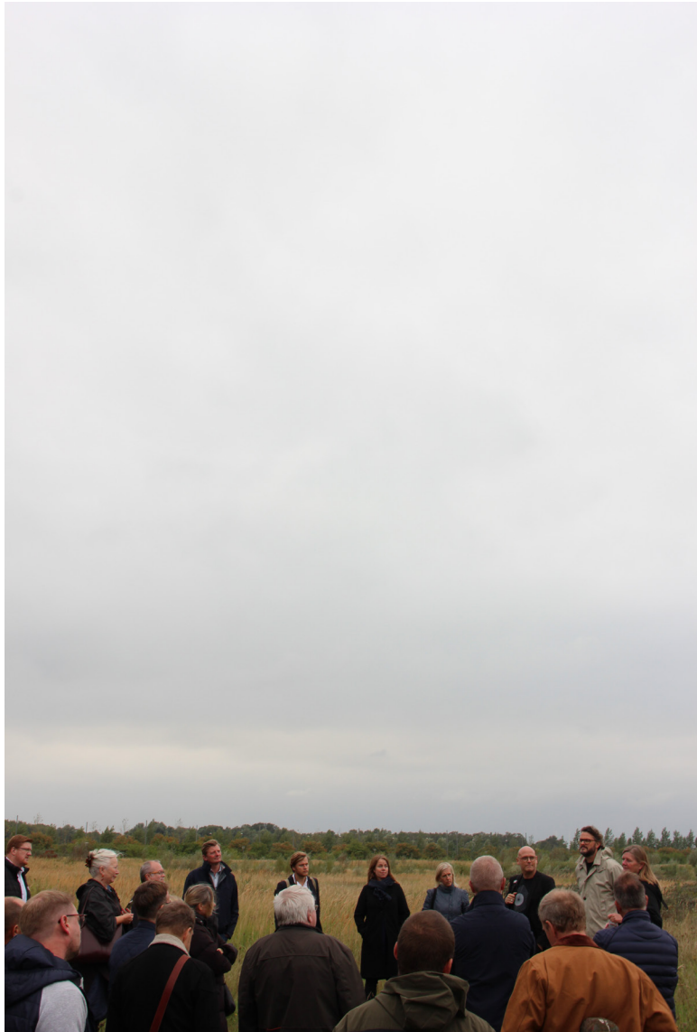
Byens Netværk samledes på de åbne arealer, der i fremtiden bliver til Vejlands-bydelen.