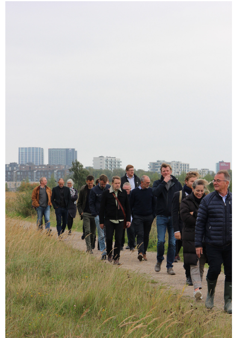
Efter oplægget var vi på vandring på Fælleden, og gik langs afgrænsningen af Vejlands kvarteret.