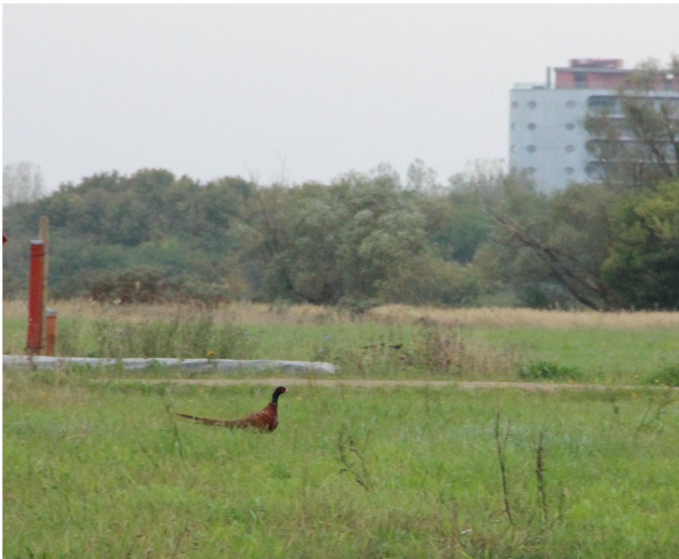
På vores vandring rundt i området, var vi heldige at støde på en Fasan i flugt over græsarealet. Det er vigtigt at bevare buskadser og krat, hvis dyrelivet fortsat skal blive i området